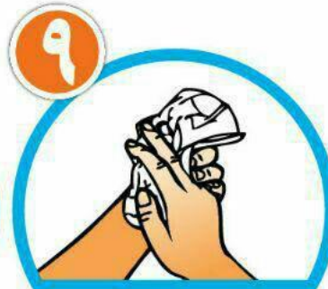
دست‌ها را با دستمال خشک کنید.