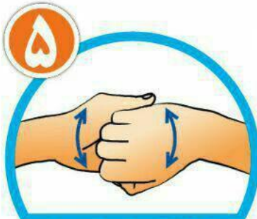
نوک انگشتان را در هم گره کرده و به خوبی بشویید.