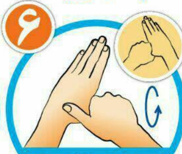
شست‌ها را جداگانه و دقیق بشویید.