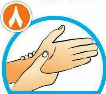
دور مچ هر دو دست را بشویید.