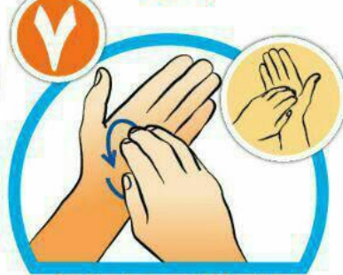
خطوط کف دست را با نوک انگشتان بشویید.