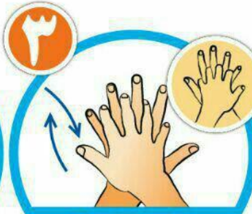
بین انگشتان را در قسمت پشت بشویید.