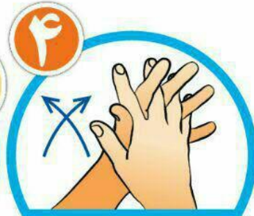
بین انگشتان را از روبرو بشویید.