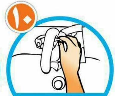
با همان دستمال شیر آب را ببندید و دستمال را در سطل زباله بیاندازید.