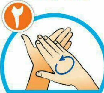
کف دست‌ها را با هم بشویید.